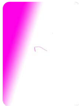
شكل (67) الأداء القبلي