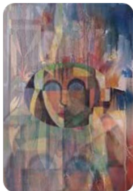
شكل (68) الأداء البعدي