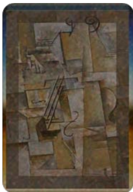
شكل (66) الأداء البعدي