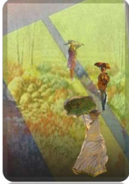
شكل ( 62 ) الأداء البعدي