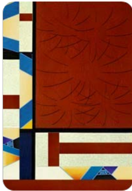
شكل (64) الأداء البعدي